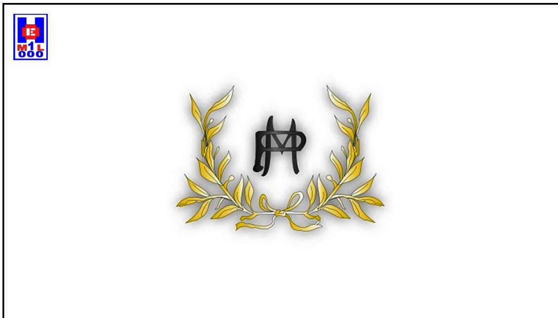
Foto 2 Emblema del Cuerpo de Practicantes Militares de 1921.

En 1921 los practicantes españoles, lograron que se creara con motivo de la Guerra de África el “Cuerpo de Practicantes Militares” que llegó a contar con cien plazas en cuarenta hospitales militares. En años sucesivos se pedirá que se haga extensivo a la península (9).