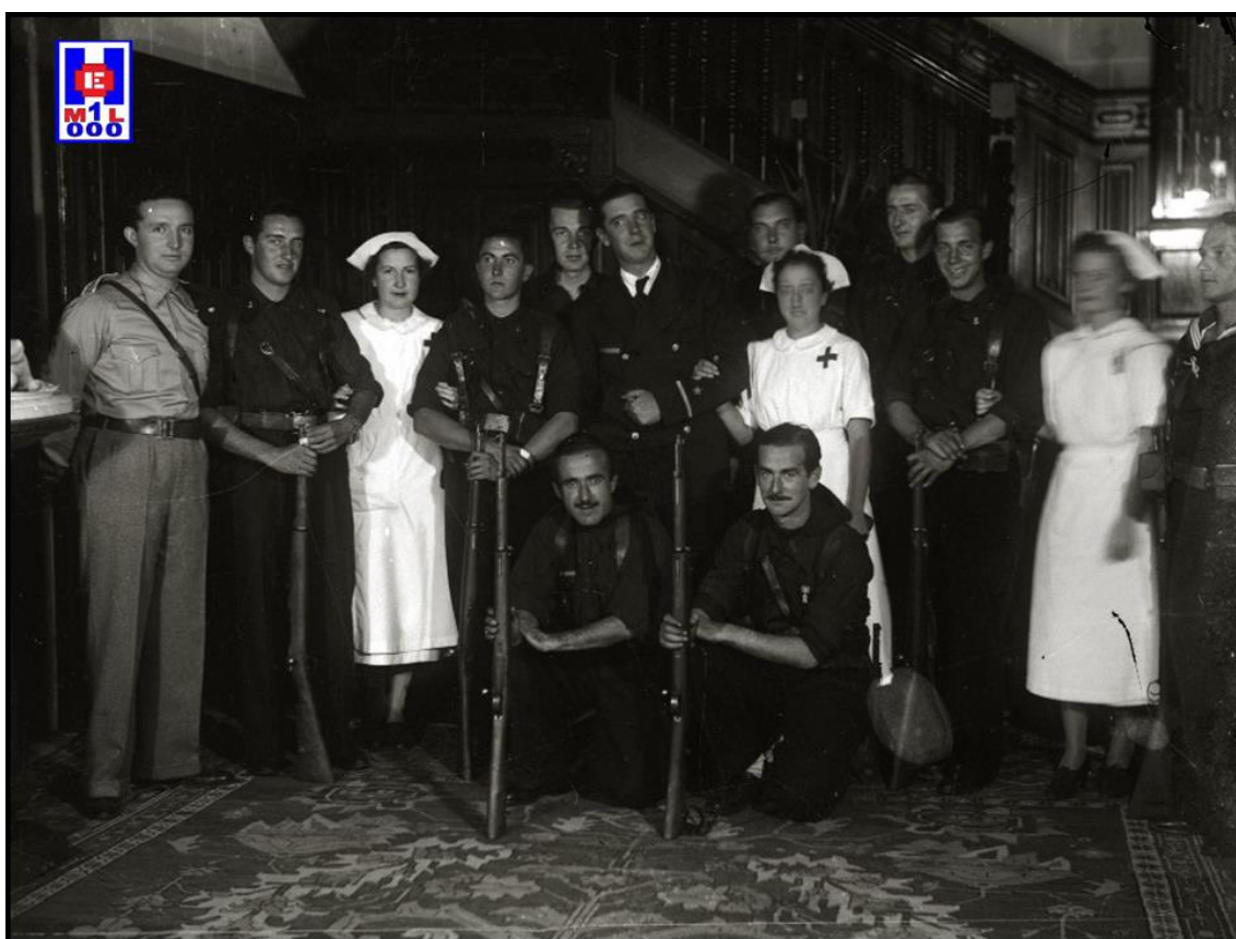
Foto 6 Enfermeras y soldados. San Sebastián 1936