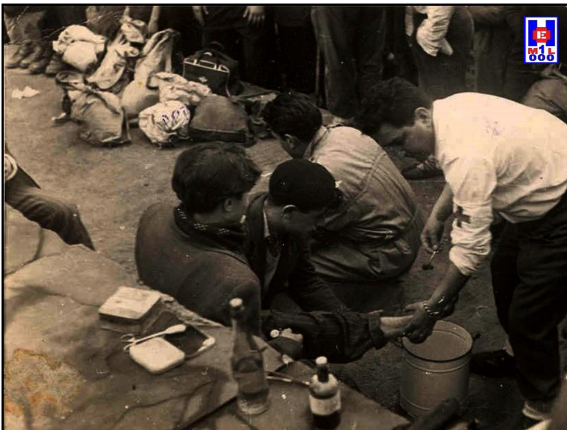
Foto 8 Practicante militar realizando una cura en la trinchera, 1939

Como divulgador de la cultura de Defensa, es colaborador habitual en publicaciones especializadas y ateneos culturales y, como autor, ha publicado varias obras sobre la Historia de la Sanidad Militar.