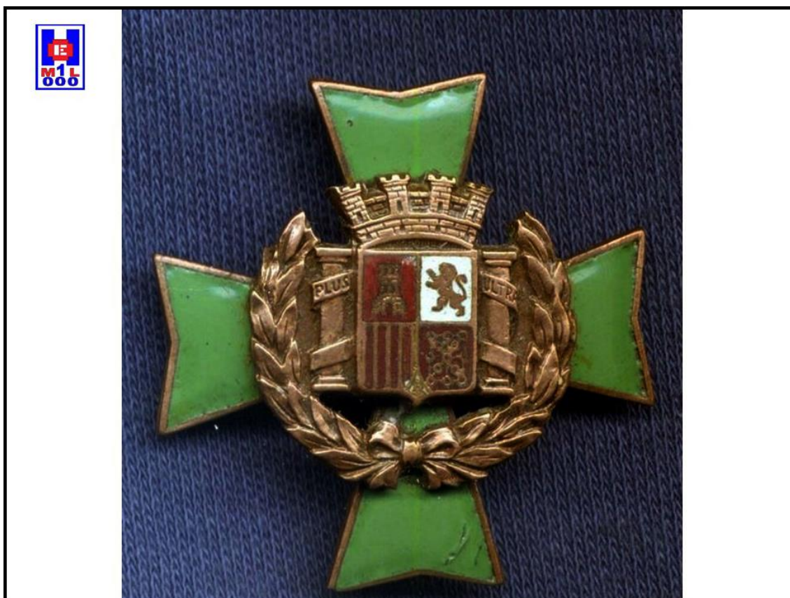
Foto 5 Distintivo en color de Jefes y Oficiales Practicantes, zona republicana